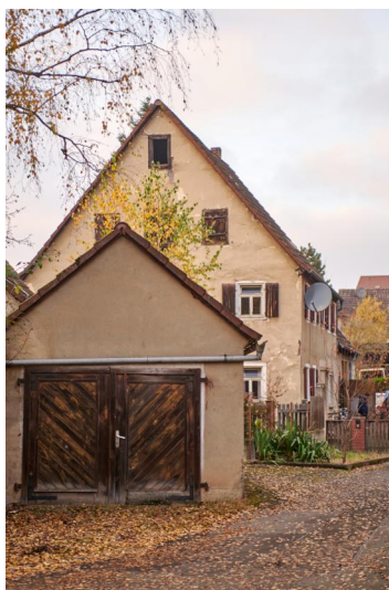
Im Hintergrund das Gebäude der ehemaligen Synagoge und jüdischen Schule. Das Gebäude wird als Wohnhaus genutzt.

Aufgrund der Größe der jüdischen Gemeinde in der zweiten Hälfte des 18. Jahrhunderts ist ein Betsaal als sicher anzunehmen, ohne dass allerdings Näheres über den Standort und die Ausstattung bekannt wäre. 1832/33 wurde eine Scheune zu einer Synagoge umgebaut (Anwesen Birkenhof 6). Bei dem Gebäude handelte es sich um einen Steinbau mit Fachwerkaufsatz, wenn die historische Aufnahme bei Alemannia Judaica richtig zugeordnet ist. Im Rahmen seiner Inventarisierung jüdischer Kulturgüter in Bayern besuchte der Kunsthistoriker Theodor Harburger in den 1920er-Jahren auch die Synagoge Diespeck. Bis zu diesem Zeitpunkt wurde die Synagoge noch gottesdienstlich genutzt. Zumindest war die Innenausstattung noch vorhanden. So fotografierte Harburger den Torschrein, der im neugotischen Stil angefertigt war. Der Gebetsraum befand sich im Dachgeschoß des Gebäudes unterhalb eines Tonnengewölbes. Weitere Bilder zeigen einen Hängeleuchter aus Messing und einen Chanukka-Leuchter. Nach Auflösung der jüdischen Gemeinde wurde die ehemalige Synagoge verkauft und 1932 zu einer Turnhalle umgebaut. 1935 wurde nach Angaben bei Alemannia Judaica das Gebäude an den unmittelbaren Nachbarn verkauft, der es abbrechen und an gleicher Stelle ein Wohnhaus erbauen ließ.