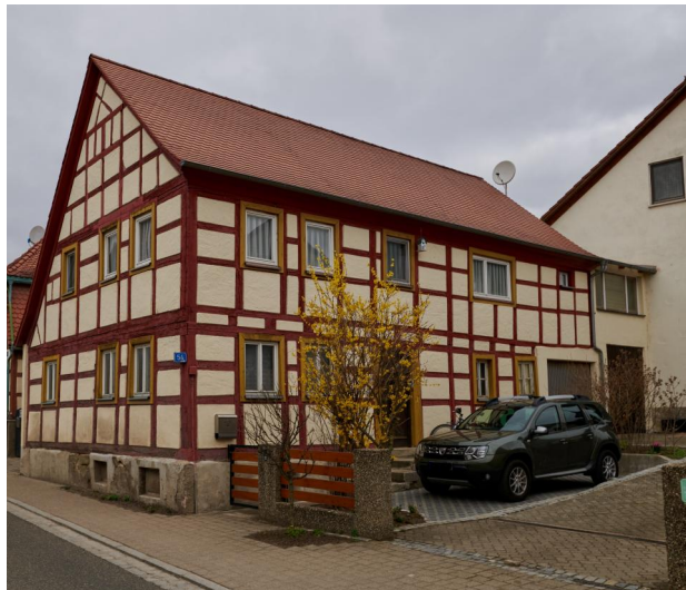
Krautostheim 54 (Aufnahme 2021).

In Krautostheim gab es laut Israel Schwierz (*1943) im 18. Jahrhundert, vielleicht auch schon früher eine kleine jüdische Gemeinde. Über Einrichtungen wie ein Gotteshaus ist nichts bekannt; jedoch ist sicher, dass im Wohnhaus Plan-Nr. 54 bis 1870 ein jüdischer Mitbürger lebte, der das Anwesen im gleichen Jahr verkaufte. Im Kellergewölbe sollen bis heute Reste einer Mikwe erkennbar sein. Im Hause ist als weiteres sichtbares Zeugnis jüdischer Vergangenheit eine Fensterscheibenritzung von 1808 erhalten.