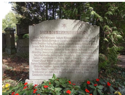
Coburg, Denkmal für die jüdischen Gefallenen 1914-18 (Aufnahme Israel Schwierz, 1996). Copyright BayHStA, BS N 80/68-14A

Eintrag des Simonschen Friedhofs im Bayerischen Denkmal-Atlas