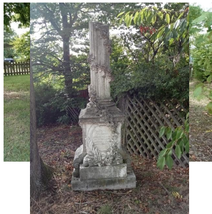
Der sogenannte Simonsche Friedhof an der Rodacher Straße in Coburg (Aufnahme 2022).