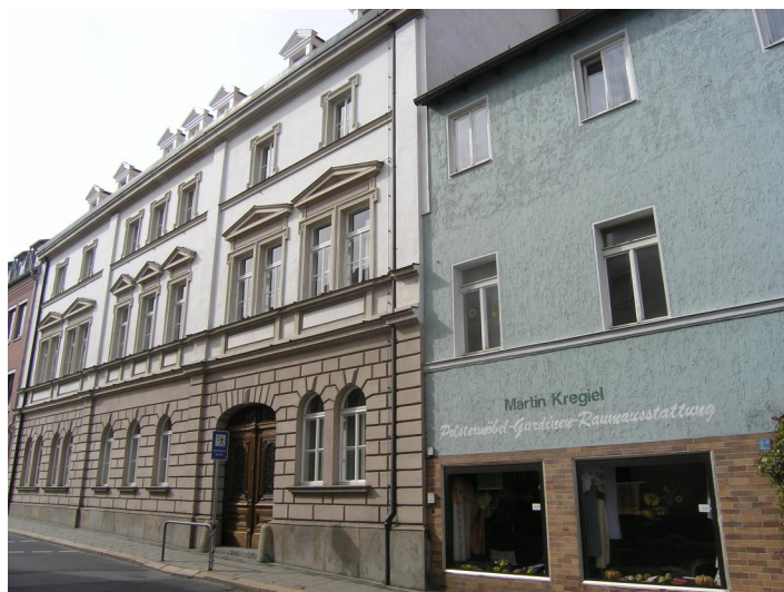
In der Propsteistraße 4, dem zweiten Haus von rechts, bestand zwischen 1895 und 1938 im ersten Stock des damaligen Gasthauses "Zur goldenen Weltkugel" ein Betsaal der jüdischen Gemeinde. Nach 1945 feierte hier jüdische DPs wieder Gottesdienst.

Eine erste Synagoge bestand wahrscheinlich beim „Judenturm“ der inneren Stadtmauer; die letzten Überreste wurden beim Stadtbrand 1873 zerstört. Am 29. Mai 1895 fand die Feier des ersten Gottesdienstes im Betsaal im ersten Stock des Gasthauses "Zur Goldenen Weltkugel" statt (Propsteistr. 4). Er wurde bis 1938, da trotz mehrfacher Planung kein Synagogengebäude errichtet wurde; dort fand auch der Religionsunterricht für die jüdischen Kinder statt. Als Folge des Novemberpogroms 1938 wurde der Betsaal geschlossen, Bücher und Kultgegenstände beschlagnahmt. Der neue Eigentümer des Hauses rettete die Innenausstattung und übergab sie 1945 der neu gegründeten jüdischen Gemeinde zurückgegeben.