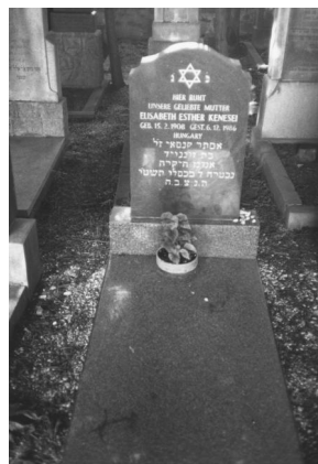
Jüdischer Friedhof Cham.