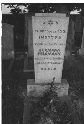
Jüdischer Friedhof Cham.