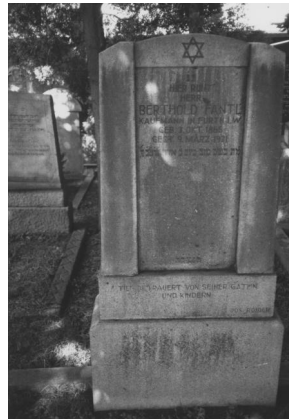
Jüdischer Friedhof Cham.