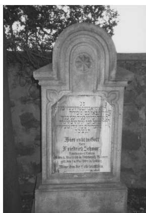
Jüdischer Friedhof Cham.