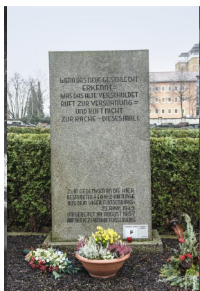
Jüdischer Friedhof Cham.