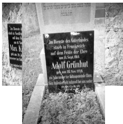
Cham, Gedenktafel für Max Kirschner auf dem jüdischen Friedhof (Aufnahme Israel Schwierz, 1996). Copyright BayHStA, BS N 80 80/25-07