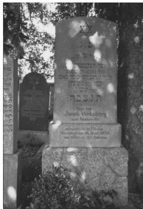
Jüdischer Friedhof Cham.