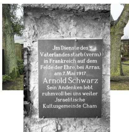
Jüdischer Friedhof Cham

Beim Vormarsch auf Cham entdeckten die amerikanischen Soldaten am 23. April 1945 zahlreiche Leichen von KZ-Häftlingen, die auf einem Todesmarsch vom KZ Flossenbürg aus entweder umgebracht worden waren oder vor Hunger und Erschöpfung gestorben waren. Ehemalige NSDAP-Mitglieder mussten im Juni 1945 die Leichen auf dem Städtischen Friedhof in Cham (Schleinkoferstr. 8, 93413 Cham) bestatten. 1950 wurde in der Anlage für die KZ-Toten und verstorbenen DPs ein Gedenkstein errichtet. 1957 erfolgte die Umbettung der Toten auf den Ehrenfriedhof der KZ-Gedenkstätte Flossenbürg.