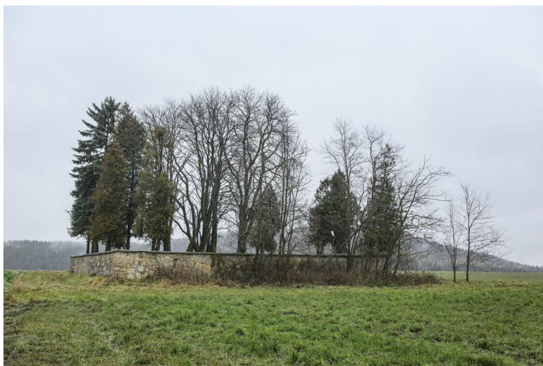
Jüdischer Friedhof Cham

Der jüdische Friedhof liegt zwischen der Stadt Cham und dem Ortsteil Windischbergendorf. Er wurde 1894 angelegt und umfasst etwa 1700 qm.