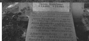
Jüdischer Friedhof Cham.