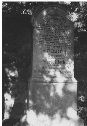
Jüdischer Friedhof Cham.