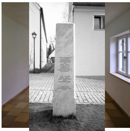
Ausstellung in den Innenräumen des begehbaren Denkmals Mikwe Buttenwiesen.