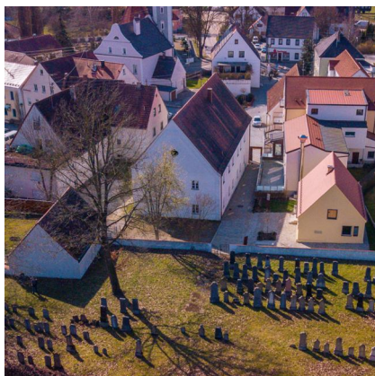
Luftbildaufnahme mit dem ehemaligen Leichenhaus (links), der Synagoge (Bildmitte), der Mikwe (rechts) und des jüdischen Friedhof (im Vordergrund), Buttenwiesen 2020.