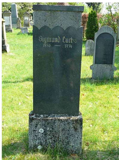
Jüdischer Friedhof Buttenwiesen.

Der jüdische Friedhof Buttenwiesen liegt mitten im Ort neben dem christlichen Friedhof und ist mit diesem durch einen Zugang verbunden. Er wurde zu Beginn der 1630er Jahre angelegt und hat eine Fläche von fast 2000 qm. Bemerkenswert ist seine Lage neben der ehemaligen Synagoge.