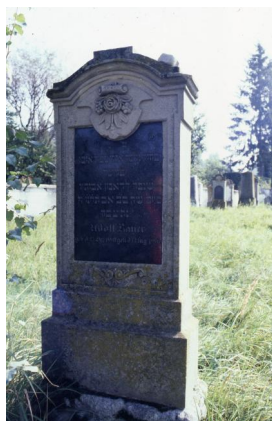
Jüdischer Friedhof von Buttenwiesen.