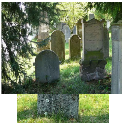
Jüdischer Friedhof Buttenwiesen.

Besonderheiten: Neben der Chewra Kaddischa war seit 1843 in Buttenwiesen auch eine Heilige Schwesternschaft tätig. Das Tahara-Haus wurde in den 1950er/60er-Jahren abgerissen. An seiner Stelle befindet sich heute eine zum Anwesen Marktplatz 8 gehörige Garage, deren Außenmaße in etwa dem früheren Tahara-Haus entsprechen. 1919/20 hatte die Israelitische Kultusgemeinde Buttenwiesen die Auffüllung des östlichen Friedhofsteils veranlasst. In diesem bis dahin nicht genutzten Teilareal richtete die Gemeinde Buttenwiesen 1950 einen Friedhof ein.