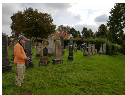
Jüdischer Friedhof Buttenwiesen.