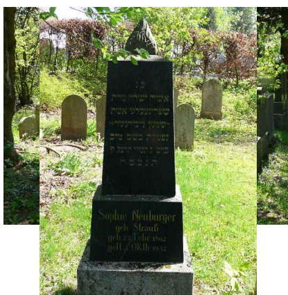
Jüdischer Friedhof Buttenwiesen.