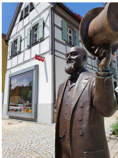
Buttenheim, Geburtshaus Levi Strauss Museum (Aufnahme 2021).

Erste Hinweise auf die mögliche Anwesenheit von Juden in Buttenheim gibt es aus der Zeit um 1450. Den konkreten Beweis liefern dann zwei Dokumente, die 20 Jahre später datiert sind. 1525 vermerkte Pfarrer Johannes Grandinger in seinen Notizen, dass sich im Oberen Schloss, nachdem es im Bauernkrieg niedergebrannt war, einige jüdische Familien angesiedelt hatten. Das Gebäude gehörte zum Lehen der Reichsfreiherrn von Stiebar. Als Quelle kann auch ein Schriftstück dienen, datiert am 30. März 1593, das ein Verbot für Juden, am Sonntag über den Kirchhof zu gehen, festlegt. Offensichtlich versuchte man mit dieser Bestimmung, ihre Handelsgeschäfte einzuschränken. Weitere Details zur jüdischen Geschichte in der frühen Neuzeit wurden bislang nicht erforscht.