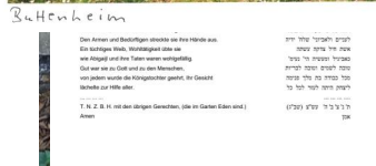
Buttenheim, jüdischer Friedhof (Gratzau), Grabstein 001: Frau Fratel bar Jakob Reis, gest. 1819 (Aufnahme 2023).