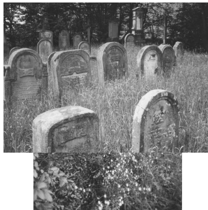
Jüdischer Friedhof Buttenheim.