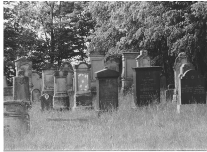
Jüdischer Friedhof Buttenheim.