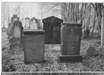
Buttenheim, jüdischer Friedhof (Aufnahme um 1985).