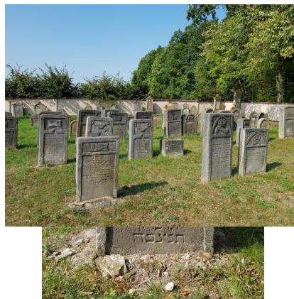
Buttenheim, Jüdischer Friedhof (Aufnahme 2020).