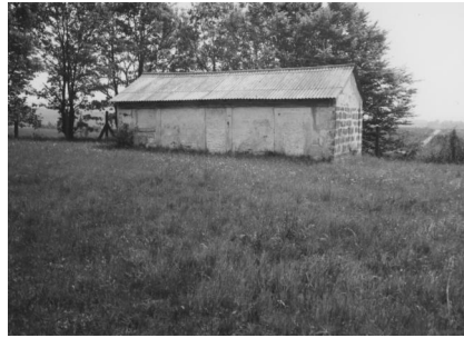
Jüdischer Friedhof Buttenheim.