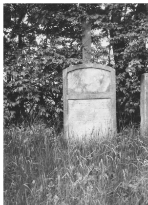
Jüdischer Friedhof Buttenheim.