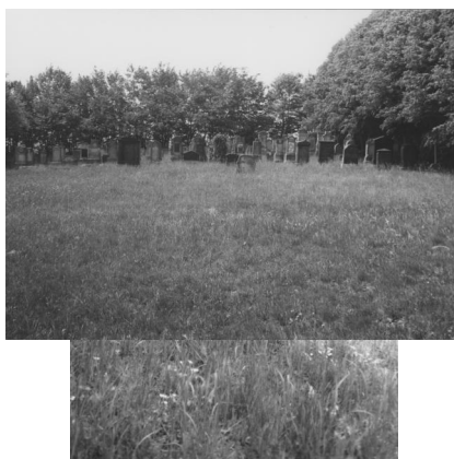
Jüdischer Friedhof Buttenheim.