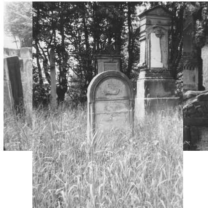
Jüdischer Friedhof Buttenheim.