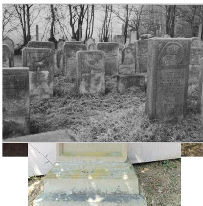
Buttenheim, Eingang zum jüdischen Friedhof Buttenheim (Aufnahme 2022).