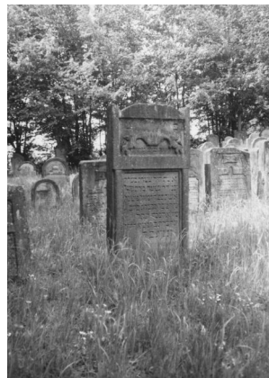
Jüdischer Friedhof Buttenheim.