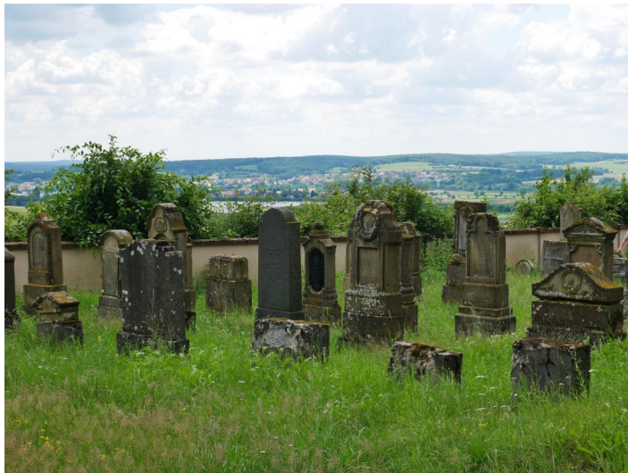
Buttenheim, Jüdischer Friedhof (Aufnahme 2020).

Der jüdische Friedhof Buttenheim liegt ca. 1,5 km nördlich des Markts seitlich der Straße von Buttenheim nach Seigendorf auf freier Höhe am Waldrand. Er hat eine Fläche von fast 2200 qm. Das früheste Grabmal ist jenes von [media:4384]Fratel bar Jakob Reis aus dem Jahr 1819[/media]. Es sind noch 253 Grabsteine erhalten (Hanke). Neben Buttenheim bestatteten die jüdischen Gemeinden Hirschaid und Gunzenhausen hier ihre Verstorbenen.