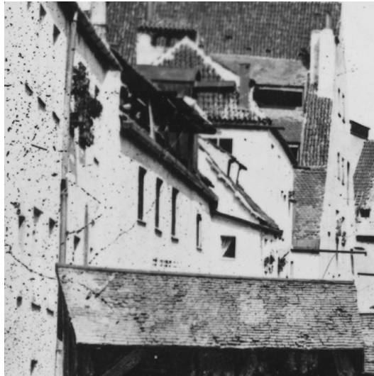
München, Blick von der Hochbrücke am Kaltenbach in den "Einschütt", links das heutige Anwesen Tal 13, im Hintergebäude die Synagoge mit drei hohen Fensterbahnen (Aufnahme 1858). StadtAM, FS-NL-KV-2111.

Nachdem Juden ab Mitte des 18. Jahrhunderts mit besonderem Privilegium wieder in größerer Zahl in München ansässig waren, feierten sie ab 1763 ihre Gottesdienste in der Wohnstätte der Familie Wertheimer. Es lag im Rückgebäude der respektablen Weinwirtschaft "Zum Weiserwirt" (Plan-Nr. 161, heute Tal 13 bzw. ab 1875 Lederergasse 5). Neben den Wertheimern lebten hier auch die Hoffaktorenfamilien Mändle und Isaak. Im Volksmund setzte sich der Hausname "Zum Judenbranntweiner" durch, der spätestens 1778 in städtischen Unterlagen auftaucht. In seiner um 1800 entstandenen Stadtbeschreibung erwähnt Hofkaplan Johann Stimmelmayer das "Judenbranntweiners und Weisers Haus, worin schon immer [sic] Juden wohnten". Der laut einem Bericht aus dem Jahr 1837 recht lange und schlichte Betsaal der Männer mit einem Thoraschrein, sowie der gleich lange abgetrennte Frauenbereich waren im zweiten Stock des Gebäudes untergebracht. Der Kaltenbach könnte eine Mikwe gespeist haben. (Stefan W. Römmelt | Patrick Charell)