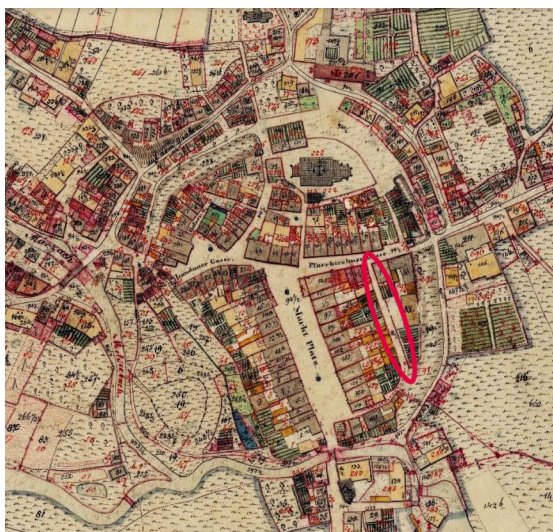
Eggenfelden, Uraufnahme 1808-1864 (Ausschnitt). Die Judengasse parallel zum Marktplatz ist rot markiert.