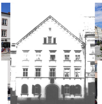
Eggenfelden, Stadtplatz 10, ehem. Büros der jüdischen "Wiedergutmachungs-Organisation" mit Betraum (Aufnahme 2023).