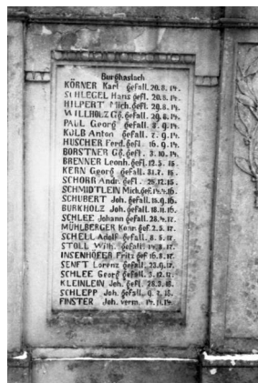
Burghaslach, Kriegerdenkmal 1870/71, 1914-18 und 1939-45 im Ortskern (Aufnahme Israel Schwierz, 1996). Copyright BayHStA, BS N 80 80/20-24A