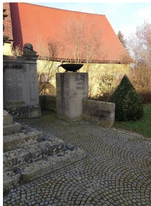
Gefallenendenkmal hinter der Kirche in Burghaslach mit den Namen der jüdischen Gefallenen des Ersten Weltkriegs aus Burghaslach.