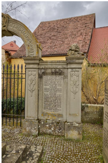
Denkmal für die Gefallenen des Ersten Weltkriegs.

Das Kriegerdenkmal von Burghaslach für die Gefallenen der Kriege 1866, 1870/71, 1914/18 und 1939/45 befindet sich im Ortskern in einer Grünanlage hinter der Kirche. Tafeln an einer Mauer mit Torbogen enthalten unter der Widmung: DEN TREUEN SCHÜTZERN DER HEIMAT 1914 – 1918 die Namen der Gefallenen des Ersten Weltkrieges, unter ihnen auch die der folgenden jüdischen Soldaten: