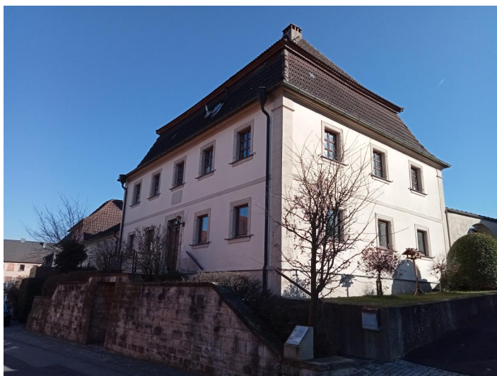
Casteller Amtshaus, früheres Casteller Gerichtsgebäude, Bamberger Straße 14. 1850 von der Familie Rosenblatt erworben, die darin bis 1938 wohnte (Aufnahme 2022).

Eine erste organisierte Judenschaft wird 1614 erwähnt, jedoch lebten bereits vorher vereinzelt Juden im Ort. Aus dem Folgejahr stammt eine Liste von vierzehn Familien, die in Burghaslach unter dem Schutz der Freiherren von Münster-Lisberg standen. Auch die Freiherren von Vestenberg hatten mit hoher Wahrscheinlichkeit Schutzjuden in jener Ortshälfte aufgenommen, die seit 1412 zu ihrem Besitz gehörte. Als die Vestenberger 1687 ausstarben und die Grafen zu Castell das halbe Amt Burghaslach erbten, teilten sie das Gebiet innerhalb ihrer Familie auf. So gab es bis 1783 gleich drei Herren: Die Grafen zu Castell-Remlingen und Castell-Rüdenhausen sowie den Freiherren von Münster-Lisberg.