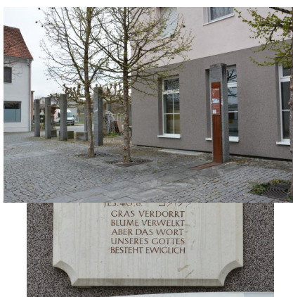
Altstadt, Memminger Straße 47, Gedenktafel vor dem Erinnerungsort der ehem. Synagoge (Aufnahme 2021).