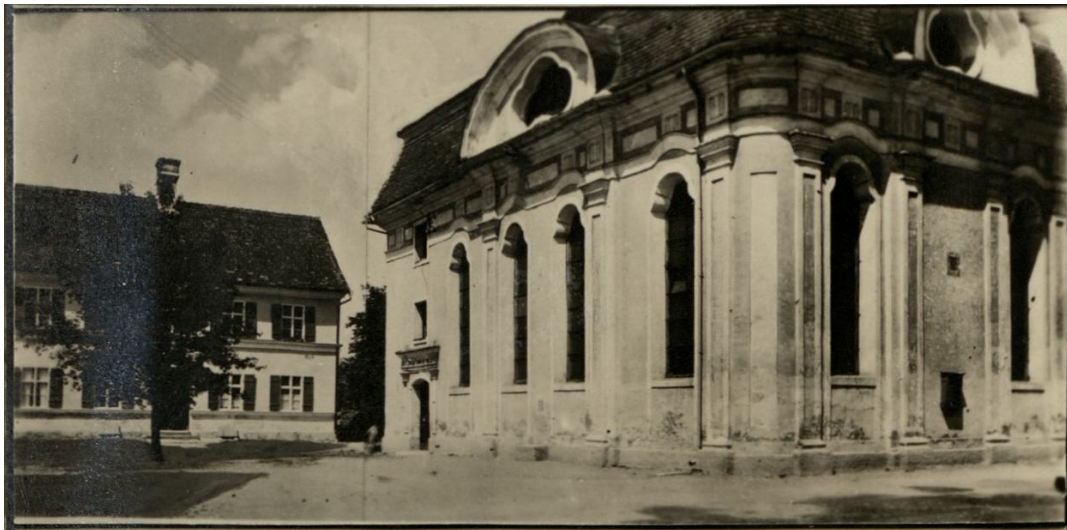
Altstadt, Synagoge an der Memminger Straße.

In einem Schutzbrief aus dem Jahr 1719 gewährten die Reichsgrafen von Limburg-Styrum ihren Schutzjuden die Errichtung einer Synagoge. Der Bau wurde 1722 genehmigt und das benötigte Bauholz kostenlos zugeteilt. Auf dem zugewiesenen Grundstück (Nr. 1202, Memminger Str. 47) entstand auf rechteckigem Grundriss ein stattlicher Saalbau mit Rundbogenfenstern und Muldengewölbe, das sich deutlich von der übrigen Bebauung abhob und mit seiner Exklusivität, die den Protest von Amtsträgern der katholischen Kirche hervorrief, die Bedeutung der Altenstädter Kultusgemeinde zum Ausdruck brachte.