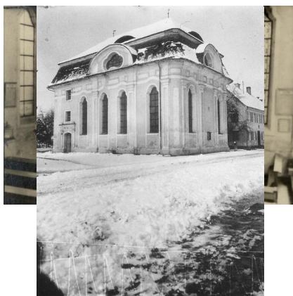
Altenstadt, Synagoge an der Memminger Straße.