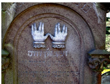
Jüdischer Friedhof Illereichen, Grabmal eines Rabbiners aus Altstadt.