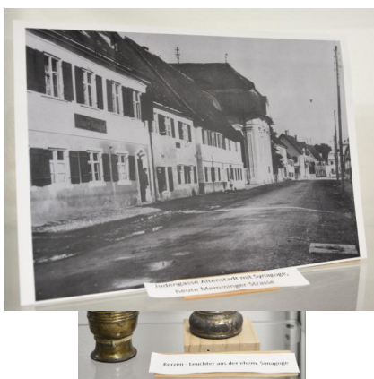
Altstadt, Ausstellung im Rathaus mit Fragmenten der Synagoge, Reste von Kerzenleuchtern aus dem Betsaal (Aufnahme 2021).