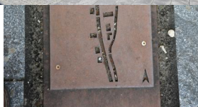
Altstadt, Memminger Straße, Erinnerungsort der ehem. Synagoge mit Informationstafel und Reliefkarte der jüdischen Ansiedlung (Aufnahme 2021).