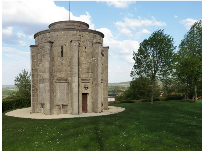
Das 1925 eingeweihte Denkmal auf dem Kapellenberg für die Gefallenen des Ersten Weltkriegs.

Das am 10. Mai 1925 eingeweihte Kriegerdenkmal von Burgbernheim für die Gefallenen der Kriege 1914/18 (und 1939/45) befindet sich auf dem Kapellenberg oberhalb der Kirche St. Johannes (links der Kirche und des Friedhofes führt ein Treppenaufgang durch eine Lindenallee zum Kapellenberg hinauf).