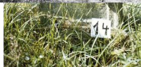
Jüdischer Friedhof Schweinshaupten.