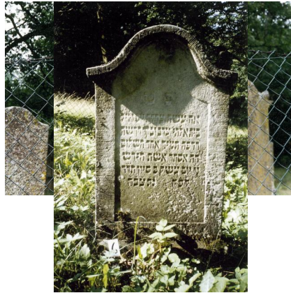
Jüdischer Friedhof Schweinshaupten.