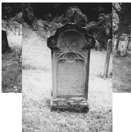
Jüdischer Friedhof Schweinshaupten.