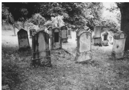
Jüdischer Friedhof Schweinshaupten.