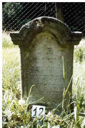
Jüdischer Friedhof Schweinshaupten.