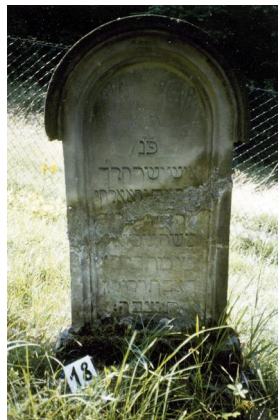
Jüdischer Friedhof Schweinshaupten.