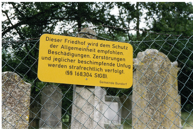
Jüdischer Friedhof Schweinshaupten.

Der jüdische Friedhof liegt östlich von Schweinshaupten am Waldrand auf einer kleinen Anhöhe. Er hat eine Größe von fast 2000 qm und wurde 1869 angelegt. Es sind noch etwa 110 Grabsteine erhalten.