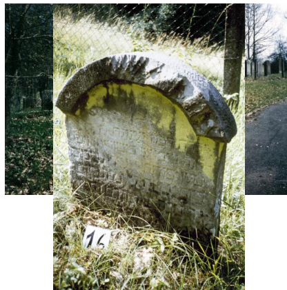
Jüdischer Friedhof Schweinshaupten.