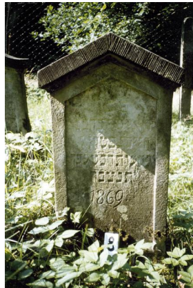
Jüdischer Friedhof Schweinshaupten.