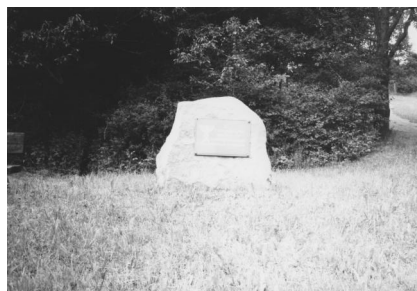
Jüdischer Friedhof Schweinshaupten.