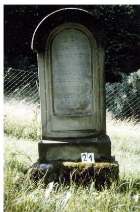
Jüdischer Friedhof Schweinshaupten.