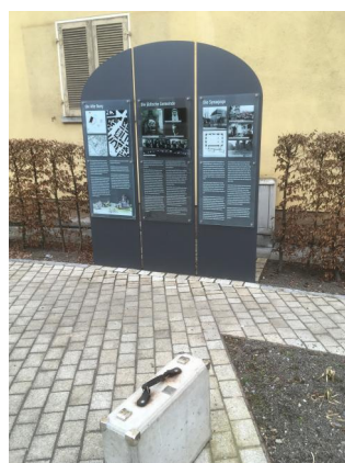
Ein neu gestalteter Platz mit drei torförmig gestalteten Informationstafeln und einer Koffer-Skulptur erinnert an die ehem. jüdische Gemeinde in Heidingsfeld (Aufnahme 2021) Das "Zwillingstück" der Skulptur