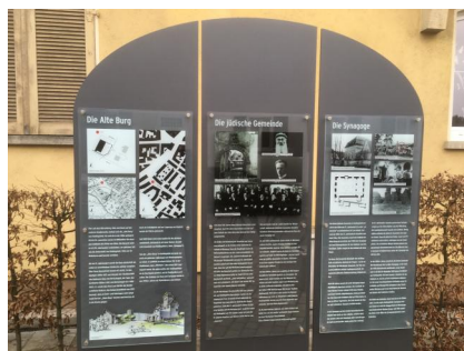
Ein neu gestalteter Platz mit drei torförmig gestalteten Informationstafeln und einer Koffer-Skulptur erinnert an die ehem. jüdische Gemeinde in Heidingsfeld (Aufnahme 2021) Das "Zwillingstück" der Skulptur

erweitert den DenkOrt Deportationen in Würzburg.