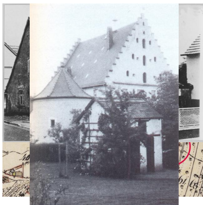
Trunstadt, ehemalige Mikve, in den 1980er-Jahren abgerissen.