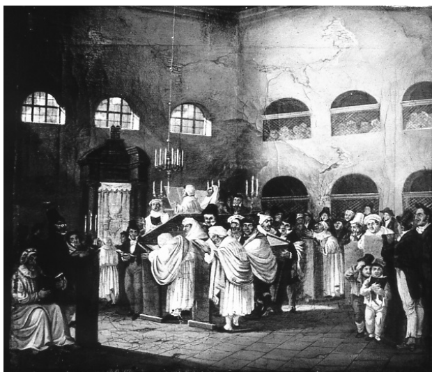
"Jom Kippur in der Heidingsfelder Synagoge", Ölgemälde aus Privatbesitz

In Heidingsfeld gab es bereits im Mittelalter eine Synagoge, die jedoch erst 1490 als "Judenschule" in der "Judengasse" (Oberstadt) in den Quellen erscheint. Weder ist bekannt, welche Straße die damalige Judengasse war (möglicherweise die Zindelgasse), noch der genaue Standort oder die Ausstattung des Gotteshauses. Im selben Jahr ließ sich die Stadt ihr Recht auf das Judenregal bestätigen. Damals lebten mindestens 17 jüdische Familien im Ort, die allein von ihrer Anzahl her schon den Minjan erfüllen konnten. 1570 wird in den Ratsprotokollen eine weitere Synagoge genannt. Sie befand sich vermutlich auf dem Grundstück des heutigen Anwesens Berggasse 4/6 in der Nähe der Pfarrkirche.