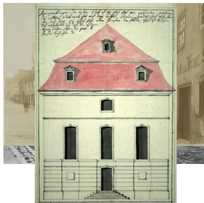
Außenansicht der 1780 erbauten Synagoge in Heidingsfeld von Nordwesten (Foto Theodor Harburger 1927). Copyright Central Archives for the History of the Jewish People, Jerusalem

Chuppa-Stein der Synagoge in Heidingsfeld, heute in der Dauerausstellung des Museums Shalom Europa (Aufnahme 2023). Copyright Museum Shalom Europa / Foto: Annette Taigel