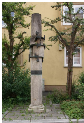
Heidingsfeld, Gedenksäule vor dem ehemaligen Synagogenstandort Dürrenberg (Aufnahme 2012).