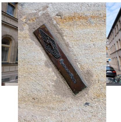
Fürth, Hallmanstraße 2/2a, ehem. Israelitisches Waisenhaus für Jungen und Mädchen, erb. ab 1884, heute Gemeindezentrum und Synagoge der IKG Fürth (Aufnahme 2018)

Im nördlichen Erdgeschoss des in den 1860er Jahren errichteten, neuen Israelitischen Waisenhauses in der Julienstraße 2 (heute Hallemannstraße 2) wurde eine elegante Synagoge mit Frauenempore eingerichtet, der die NS-Diktatur im Kern unbeschadet überdauert hat. Er wirkt vor allem durch seine helle klassizistische Ausstattung: Polierte Marmorsäulen, welche die Empore tragen, und ein Toraschrein in Form einer zierlichen Ädikula mit gedrehten, Weiß und Gold gefassten Säulen. Zwei Leuchter aus dem barocken Vorgängerbau des Waisenhauses sind erhalten (= Waisenschul). Die Synagoge wurde behutsam modernisiert und dient derzeit der IKG Fürth als Gotteshaus. Im Flur hängt eine Gedenktafel für Direktor Dr. Ismar Isaak Hallemann, das jüdische Personal und die Kinder, die gemeinsam am 22. März 1942 in das Vernichtungslager Izbica deportiert wurden. Im Dachgeschoß des Gebäudes befindet sich eine restaurierte Sukka, im Keller eine Mikwe.