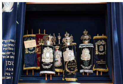
München, St.-Jakobs-Platz 18, Innenansicht des Betsaals der neuen Synagoge "Ohel Jakob" (Aufnahme 2014).