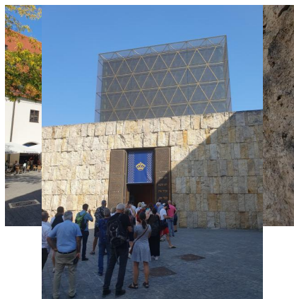
München, St.-Jakobs-Platz, Jüdisches Zentrum mit Synagoge, Gemeindezentrum und Museum (Aufnahme am Europäischen Tag der jüdischen Kultur 2023).