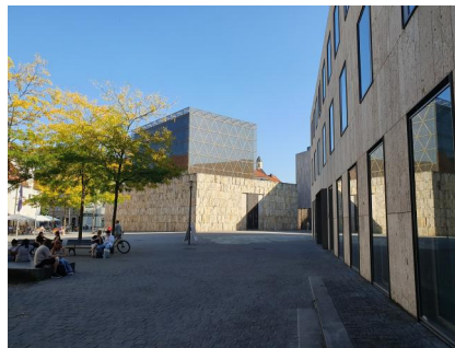
München, St.-Jakobs-Platz 18, der von Georg Solanica-Pollack gestaltete "Gang der Erinnerung" (Aufnahme 2014).