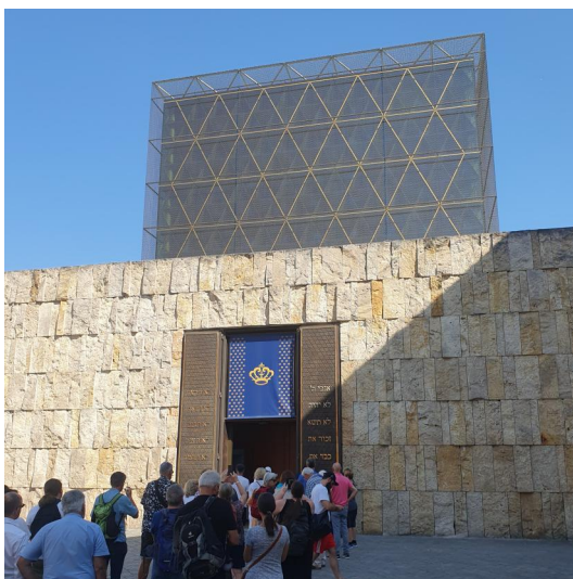
München, St. Jakobs-Platz, Synagoge Ohel Jakob (Aufnahme 2023).

Zur Jahrtausendwende sollte in München endlich wieder ein angemessenes jüdisches Gemeindezentrum entstehen. Als Bauplatz wurde nicht zuletzt wegen seines Namens der zentral gelegene St.-Jakobs-Platz gewählt. Im Jahr 2000 setzte sich ein Entwurf durch, der sich durch eine postmoderne Architektur bewusst von der historischen Umgebung abheben will. Das dreigliedrige Ensemble besteht aus dem Gemeindezentrum mit Ritualbad, Restaurant und Veranstaltungsfläche, dem Jüdischen Museum München , sowie der neuen Hauptsynagoge der IKG München und Oberbayern . Das jüdische Kulturzentrum mit seinem vielseitigen Angebot schafft zwischen der Sendlinger Straße und dem Viktualienmarkt einen neuen Fixpunkt im Herzen der Altstadt.