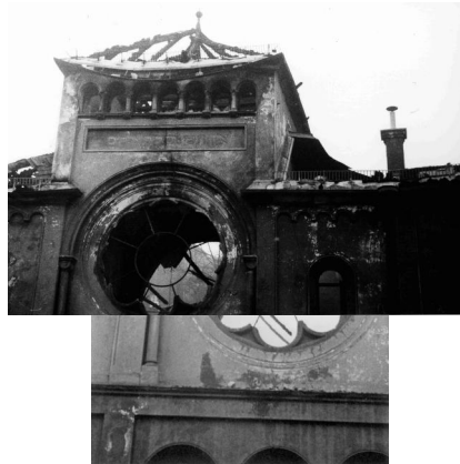
München, Herzog-Rudolf-Straße 5, ausgebrannte Ruine der orthodoxen Synagoge Ohel Jakob nach dem Novemberpogrom (Detail): Geborstene Rosette an der Westfassade (Aufnahme 11. November 1938).