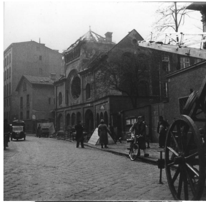
München, Herzog-Rudolf-Straße 5, ausgebrannte Ruine der orthodoxen Synagoge Ohel Jakob nach dem Novemberpogrom (Aufnahme 11. November 1938).