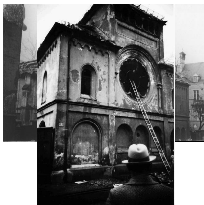
Vorderfront des ausgebrannten Gebäudes der Synagoge Ohel Jakob in der Herzog-Rudolf-Straße 3/5 nach dem Novemberpogrom 9./10. November 1938 (Foto Heinrich Hoffmann). Copyright Bayerische Staatsbibliothek / Bildarchiv (hoff-21990)