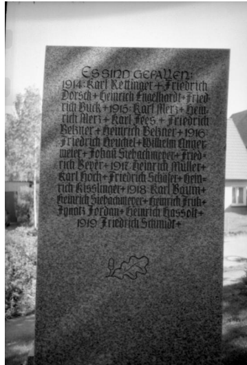
Wittelshofen, Kriegerdenkmal, rechte Seite mit den Namen der Gefallenen.

Das Kriegerdenkmal für die Gefallenen beider Weltkriege befindet sich neben der evang.-luth. Martinskirche am Kirchweg.