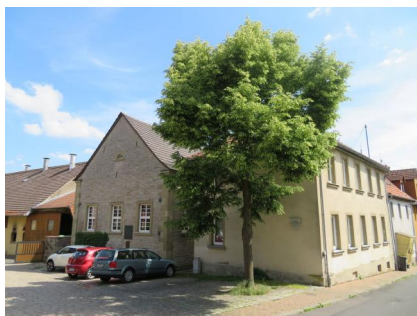
Gebäude der 1819 errichteten ehemaligen Mikwe in Gaukönigshofen (Aufnahme 1980er-Jahre)