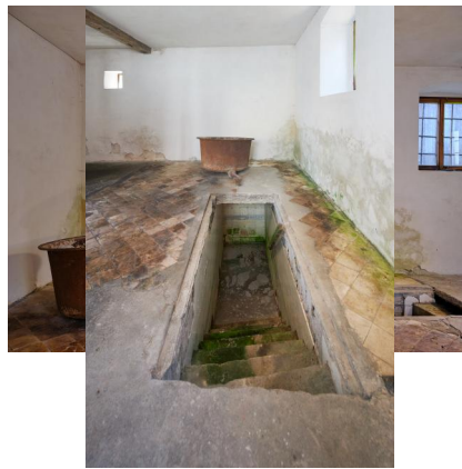
Gaukönigshofen, Am Königshof o.Nr., ehem. Mikwe (Aufnahme 2021).