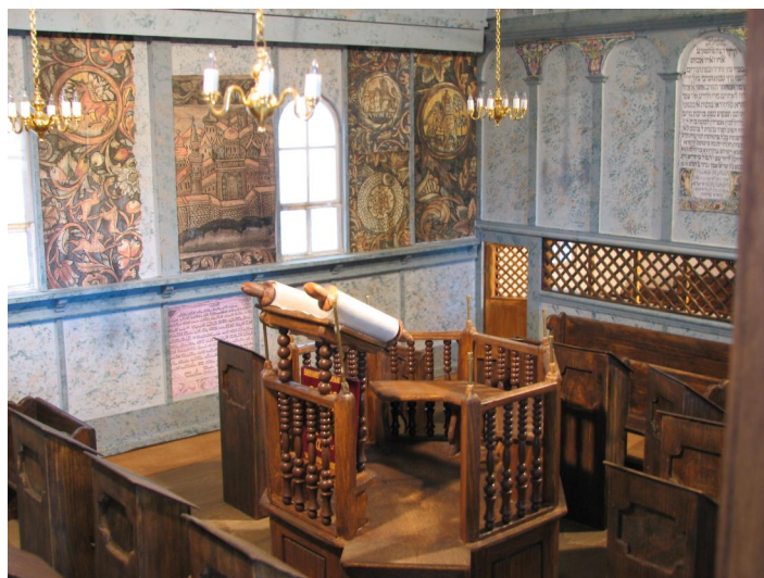
Modell und Detailansichten der Synagoge Bechhofen, überarbeitet 2007.

Die frühe Kultusgemeinde besaß bereits vor dem Dreißigjährigen Krieg eine „feine Juden Schul“, die durch eine brandschatzende Soldateska „alda ruinieret worden“ ist. Über den Standort oder das Aussehen dieser ersten Synagoge ist nichts bekannt, auch ist unklar ob sich die Gemeinde danach in einem halb zerstörtem Gebäude oder einem privatem Betraum versammelte. Für die verarmten Bechhofer Juden war es jedenfalls zunächst dringlicher, ihren Familien wieder ein Heim und Auskommen zu schaffen. Als sich die Lage langsam besserte und ihre Zahl beständig anwuchs – 1681 stellten Juden fast ein Drittel der 230 Einwohner – wandte sich der Vorstand mit einer Bittschrift an Markgraf Johann Friedrich III. von Brandenburg-Ansbach (reg. 1667-1686), um die Genehmigung für einen Synagogen-Neubau einzuholen.