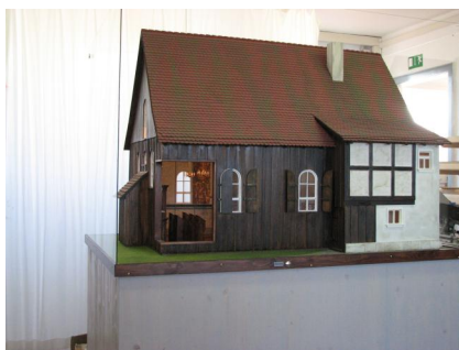
Modell und Detailansichten der Synagoge Bechhofen, überarbeitet 2007. Copyright AWO Therapiezentrum & Museum Schloss Cronheim

Eine vollständige Transkription des Films finden Sie hier: [media:1825][media]