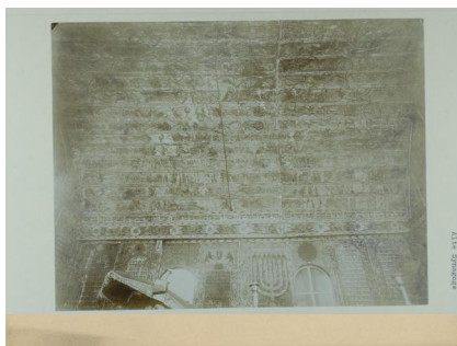
Innenansicht der Synagoge Bechhofen.