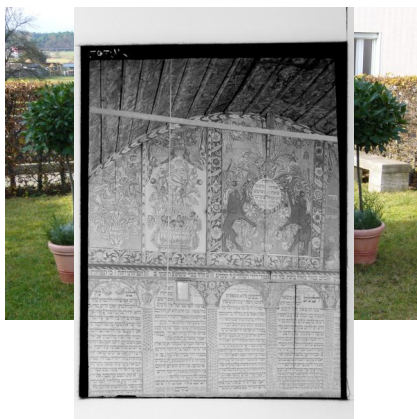
Denkmal auf dem ehemaligen Synagogenplatz in Bechhofen.