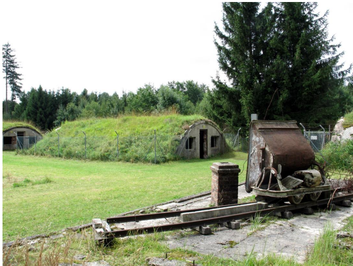
Nur noch wenige Zeugnisse der Lagers Kaufering VII sind noch erhalten, darunter drei Erdbaracken, die ein Tonröhrengewölbe besitzen.

Ab Juni 1944 entstand im Großraum des Landkreises Landsberg am Lech der KZ-Lagerkomplex Kaufering mit elf Außenlagern des Konzentrationslagers Dachau. Unter Ausbeutung der Arbeitskraft von überwiegend jüdischen Zwangsarbeitern sollten hier unter der Oberbauleitung der Organisation Todt (Deckname Ringeltaube) drei halbunterirdische bombensichere Bunker zur deutschen Flugzeugproduktion entstehen. Ein Teil des ehemaligen KZ-Lagers Kaufering VII konnte durch jahrzehntelanges bürgerliches Engagement in einen würdigen Zustand versetzt, für die kommenden Generationen gesichert und zur Europäischen Holocaustgedenkstätte ausgebaut werden.