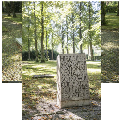
Ehrenhain für die Opfer des Nationalsozialismus auf dem Friedhof am Perlacher Forst