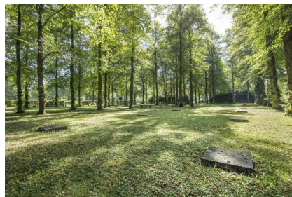
Ehrenhain für die Opfer des Nationalsozialismus auf dem Friedhof am Perlacher Forst