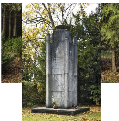
Jüdischer Friedhof München-Schwabing