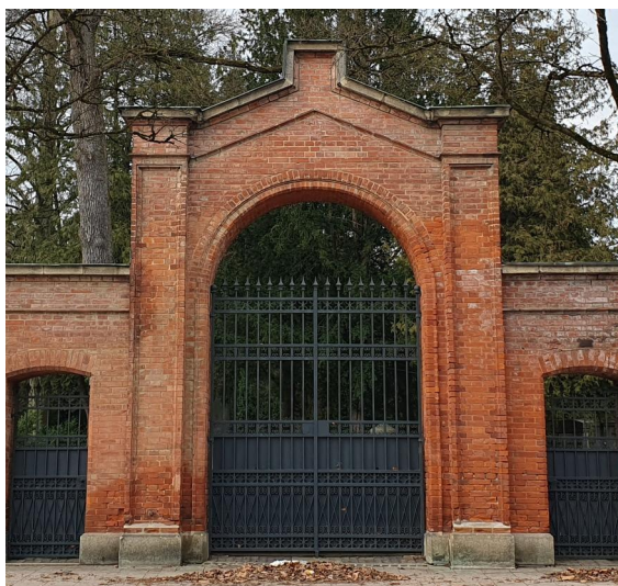
München, Thalkirchener Straße 240, ummauerter jüdischer Friedhof mit Taharahaus und Einfahrtstor (Aufnahme 2023).

Vom mittelalterlichen Friedhof der jüdischen Gemeinde in München gibt es keine Spuren mehr. Nach der Möglichkeit der Wiederansiedelung in München wurde 1816 in Thalkirchen eine neue Begräbnisstätte angelegt, der heutige Alte Israelitische Friedhof. Wegen des großen Wachstums der Kultusgemeinde legten die Münchner Juden im Jahr 1904 im Stadtteil Schwabing einen weiteren Friedhof an, den Neuen Israelitische Friedhof.