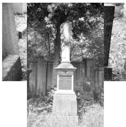
München, jüdischer Friedhof an der Thalkirchner Straße, Grabstein von Ernst Steindler (Aufnahme Israel Schwierz, 1996). Copyright BayHStA, BS N 80 80/40-21A