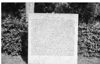
München, Neuer Jüdischer Friedhof, Kriegerdenkmal für die Gefallenen des Ersten Weltkriegs.