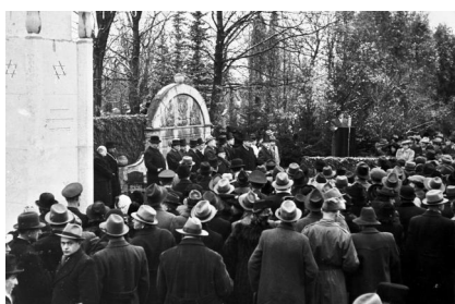
München, Neuer Jüdischer Friedhof, Grabmal für David Rossnitz (Aufnahme Israel Schwierz, 1996). Copyright BayHStA, BS N 80 80/44-00A