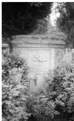
München, jüdischer Friedhof an der Thalkirchner Straße, Grabstein von Kurt Wachsmann (Aufnahme Israel Schwierz, 1996). Copyright BayHStA, BS N 80 80/40