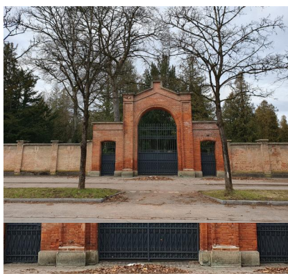
München, Thalkirchener Straße 240, ummauerter jüdischer Friedhof mit Taharahaus und Einfahrtstor (Aufnahme 2023).

Besonderheiten: Links vom Eingangstor Friedhofswärterhaus mit Wohnung, Büro- und Verwaltungsräumen. Einige Meter weiter steht das große Friedhofsgebäude, das von 1905 bis 1907 vom Architekten Hans Grassel errichtet wurde. Es enthält die Tahara- und die Trauerhalle, mehrere andere Räume sowie das Ehrenmal für die Gefallenen des Ersten Weltkriegs.