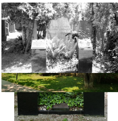
München, Neuer jüdischer Friedhof, Ehrengrab für Gustav Landauer und Kurt Eisner (Aufnahme 2012).