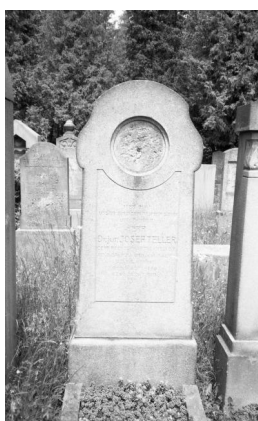
München, jüdischer Friedhof an der Thalkirchner Straße, Epitaph für Jakob Ofner (Aufnahme Israel Schwierz, 1996). Copyright BayHStA, BS N 80 80/40-06A