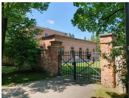
München, Thalkirchener Straße 240, ummauerter jüdischer Friedhof mit Taharahaus und Einfahrtstor (Aufnahme 2023).