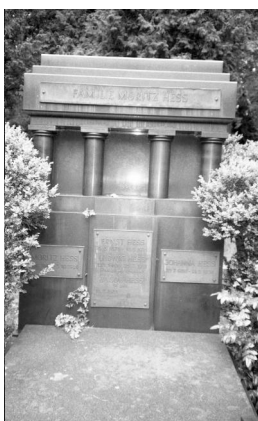
München, jüdischer Friedhof an der Thalkirchner Straße, Familiengrab Steinhardt (Aufnahme Israel Schwierz, 1996). Copyright BayHStA, BS N 80 80/41-17