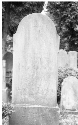
München, jüdischer Friedhof an der Thalkirchner Straße, Familiengrab Guggenheimer mit Epitaph für Fritz Guggenheimer (Aufnahme Israel Schwierz, 1996). Copyright BayHStA, BS N 80 80/38-04A