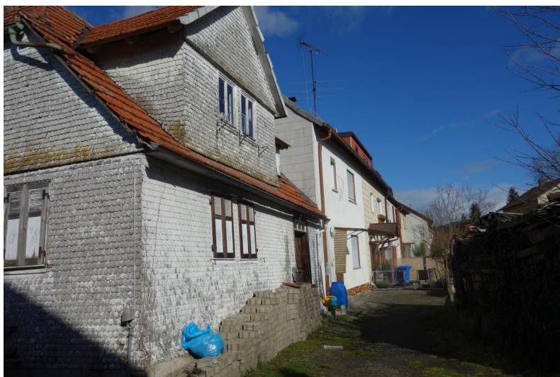
Zeitlofs, Obere Judengasse von Südwesten mit ehem. Tropfhäusern der Thungen'schen Schutzjuden (Aufnahme 2020).