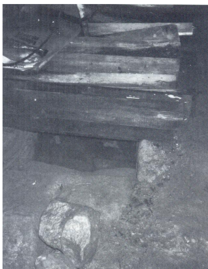
Mikwe aus der 2. Hälfte des 19. Jahrhunderts in Friesenhausen. 1988 war das Tauchbecken im Original erhalten, ebenso die ursprünglichen Treppenstufen und der steinerne Rundbogen.